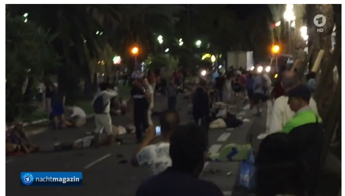
2 – Nachtmagazin , ARD, gesendet in der Nacht vom 14. auf den 15.07.2016, Screenshot [ursprünglicher Link nicht mehr aktiv]