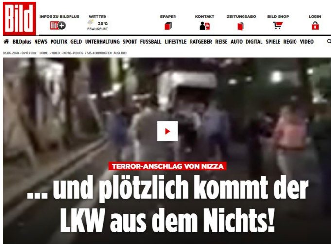
3 – „...und plötzlich kommt der LKW aus dem Nichts!“, in: bild.de, 15.07.2016, Screenshot, online: https://www.bild.de/video/clip/nizza-terror/neues-nizza-video-der-moment-in-dem-das-fest-zum-massaker-wurde-46853350.bild.html , zuletzt am 4.6.2020