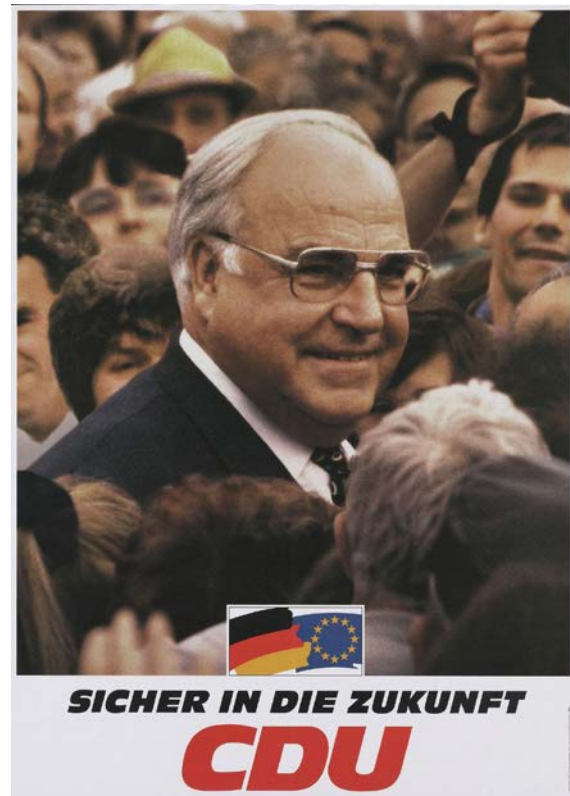
4 – [Unbekannt], Sicher in die Zukunft – CDU , Wahlplakat der CDU-Bundesgeschäftsstelle Bonn 1994, https://www.hdg.de/lemo/bestand/objekt/plakat-sicher-in-die-zukunft-cdu-1994.html , zuletzt am 14.6.2020