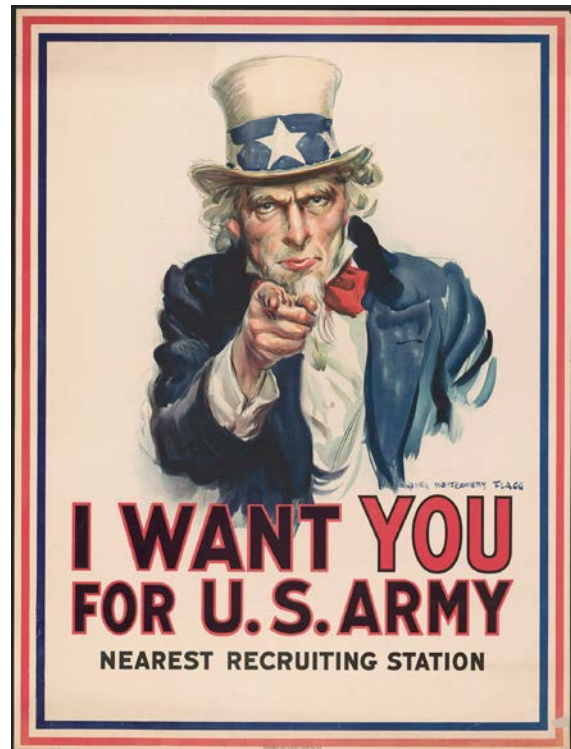
2 – James Montgomery Flagg, Uncle Sam , 1917. Poster der U.S. Army zur Rekrutierung von Soldaten https://en.wikipedia.org/wiki/Uncle_Sam , zuletzt am 14.6.2020

Betrachtet man die Verwendung des Begriffs über das gesamte 20. Jahrhundert hinweg, zeigt sich allerdings, dass die negative Konnotation relativ jungen Datums ist. In der ersten Hälfte des Jahrhunderts war Propaganda eher ein Synonym für Werbung, die als legitime Strategie des Anpreisens von Waren, Veranstaltungen oder Parteien verstanden wurde. Erst nach dem Zweiten Weltkrieg setzten sich zunehmend negative Verwendungen und der Generalverdacht der Manipulation durch – in der Bundesrepublik sicher unter dem Einfluss der Aufarbeitung nationalsozialistischer Geschichte. Schließlich hatten die Nazis das für politische Information zuständige Ministerium als Propagandaministerium bezeichnet, während die Kommunistische Partei in der Sowjetunion zeitgleich eine Abteilung für Agitation und Propaganda etabliert hatte. In den Vereinigten Staaten wurde der Begriff von der United States Information Agency noch bis in die 1970er Jahre hinein ganz selbstverständlich im positiven Sinn als Synonym für werbende Information gebraucht. Heute ist „Propaganda“ indes kein gängiger Ausdruck mehr und wird