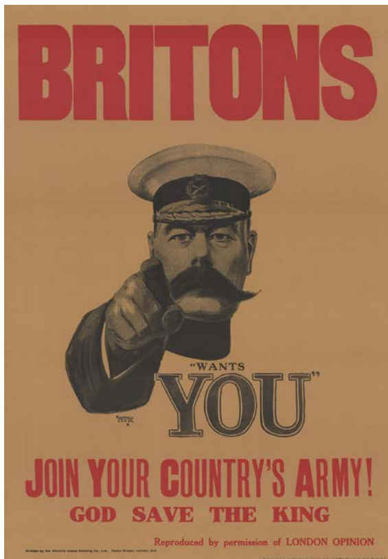
1 – Alfred Leete, Lord Kitchener Wants You , 1914. Poster der Britischen Armee zur Rekrutierung von Soldaten, https://en.wikipedia.org/wiki/Lord_Kitchener_Wants_You , zuletzt am 14.6.2020

Der Begriff Propaganda bezeichnet laut Online-Ausgabe des Dudens die „systematische Verbreitung politischer, weltanschaulicher o[der] ä[hnlischer] Ideen und Meinungen mit dem Ziel, das allgemeine Bewusstsein in bestimmter Weise zu beeinflussen“. Als Synonyme sind die Begriffe Aufklärungskampagne, Agitation, Hetze, Stimmungsmache und Indoktrination aufgeführt, die mit Ausnahme der beiden ersten eindeutig negativ besetzt sind. 1 Wer Propaganda betreibt, versucht zu manipulieren, uns Meinungen aufzudrängen, die nicht die unseren sind, und uns vor einen Karren zu spannen, den wir aus freien Stücken nicht ziehen würden. Aus dem Lateinischen stammend, wird der Begriff vor allem mit sprachlichen Botschaften in Verbindung gebracht. Im alltäglichen Gebrauch schließt er aber Bildbotschaften ganz selbstverständlich ein, zum Beispiel wenn wir von Wahlpropaganda in Form der grafischen Gestaltung von Plakaten sprechen.